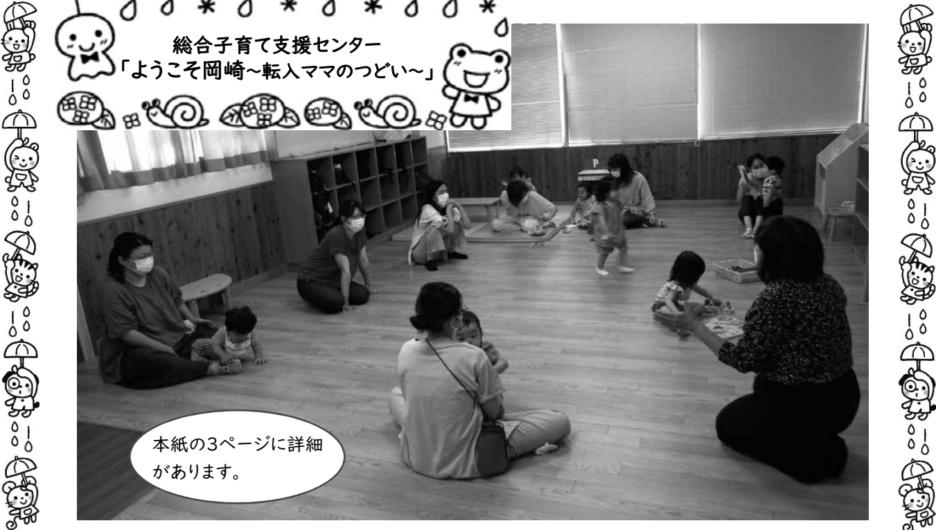
総合子育て支援センター 「ようこそ岡崎～転入ママのつどい～」