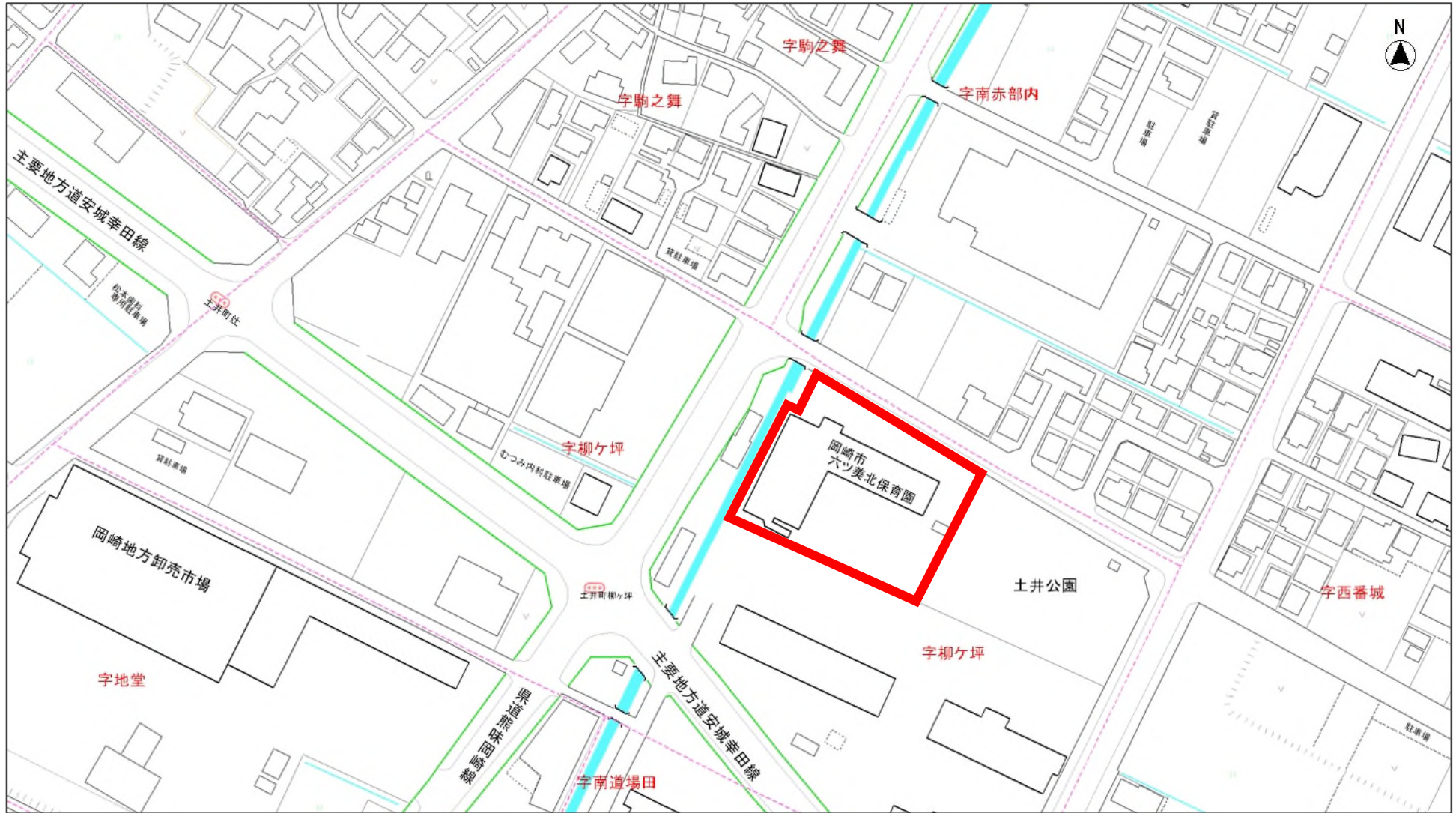
岡崎市六ツ美北保育園位置図（岡崎市土井町字柳ヶ坪8番地）