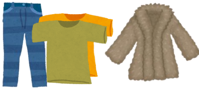
衣服・毛皮製品 (一般的に死装束とされる範囲は可)