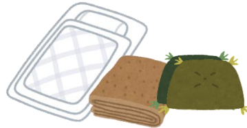
布団・毛布・座布団