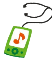
音楽プレーヤー等