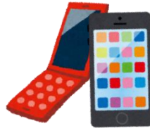
携帯電話・タブレット