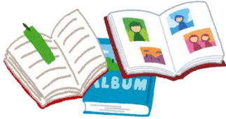
書類 (聖書、経書、アルバム等も含む)