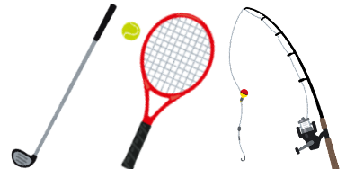
カーボン製品 (釣り具・ラケット等)

※ペースメーカー及び類似する機器の有無の確認及び斎場への連絡は必ず行ってください。ペースメーカー等を装着されているご遺体の火葬は、爆発する恐れがありますので、医師と相談し事前の取り外しをお願い致します。やむを得ず取り外せない場合は、岡崎市斎場に事前に申入れ頂くようお願い致します。