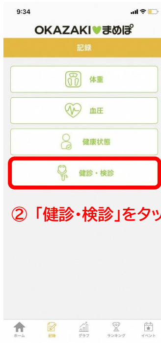
② 「健診・検診」をタップする