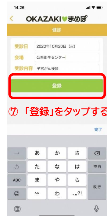
⑦ 「登録」をタップする