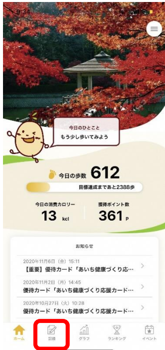
① 「記録」をタップする