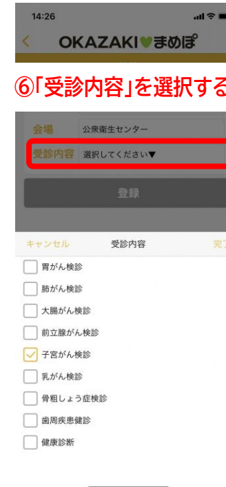
⑥ 「受診内容」を選択する