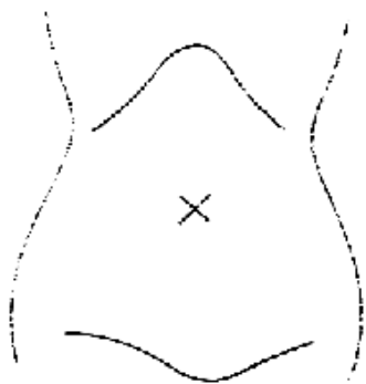
(腸瘻及びびらんの部位等を図示)