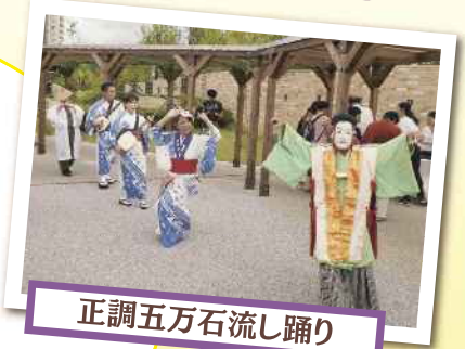
正調五万石流し踊り

これからも、出会いの杜公園を、地域の賑わい創出、交流の場として活用していただければ幸いです。