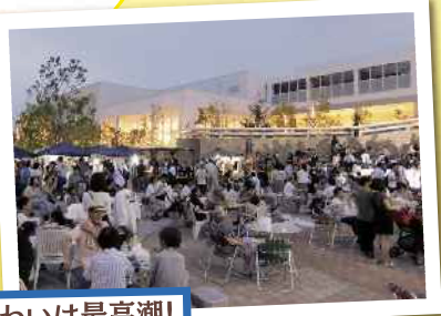
夕刻になり賑わいは最高潮!

主催 出会いの駅おかざき推進協議会・岡崎商工会議所・岡崎市 協力 岡崎城下家康公夏まつり実行委員会 岡崎えきまえ発展会・(一社)岡崎市観光協会 開催日 令和元年7月26日(金) 場所 出会いの杜公園(岡崎駅東口)