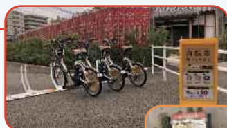
シビックセンター前

シビックセンター前とバラの広場にサイクルポートを設置しました。自転車をシェアして、乗りたいポートで乗って降りたいポートで降りることができます。ちょっと近くのコンビニに。通学に。課外活動に。いろいろな用途にお使いいただけます。