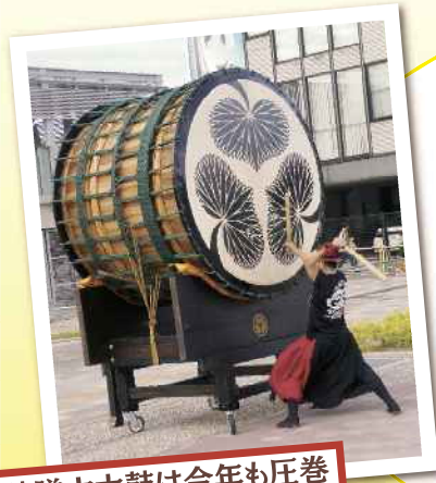
味噌六太鼓は今年も圧巻

長い梅雨が明け、今年も暑い夏がやってきました。岡崎城下家康公夏まつりの一環として、ビアガーデンイベントが開催されたのは、今回で2回目。終盤、激しい雨にも見舞われましたが、にぎやかな夏の始まりとなりました。ご来場いただきました皆様、ありがとうございました。