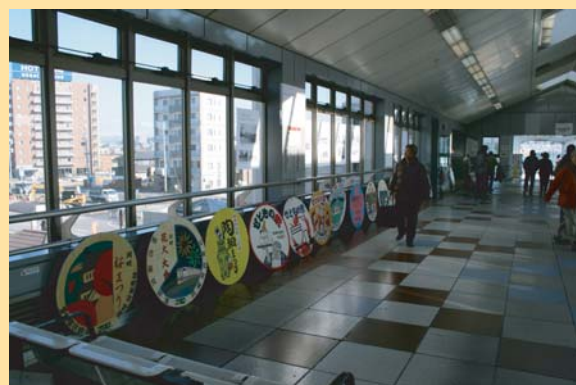
ヘッドマークの展示 （岡崎城西高校・愛知環状鉄道）