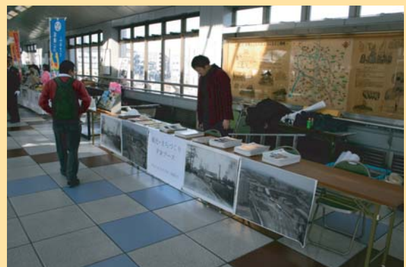
観光・まちづくりPR (Plan do おかざき・岡崎市)