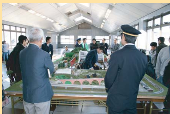
鉄道模型の展示 （岡崎城西高校）