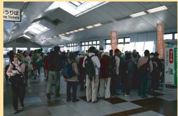
さわやかウォーキングゴール受付 (JR東海)