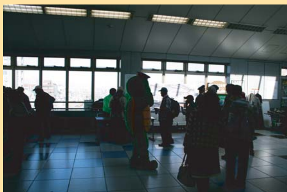
おたのしみ抽選会 （愛知環状鉄道）