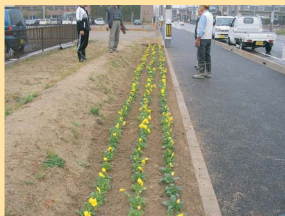
区画整理課管理地