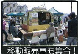
移動販売車も集合！

マルシェは、「三河のてまひま」をテーマに駅前の商店のほか三河各地の店舗 48 店が集まり、多くの来街者で賑わいましたが、駐車場の混雑といった意見も多くいただきました。今回のマルシェが、岡崎駅前の賑わいづくりだけでなく、これまでまちづくりに縁のなかった地元の方にも、今後のまちづくり活動に参加していただく一つの機会となればと考えています。