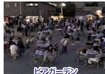
ビアガーデン (おとなの夏まつり)