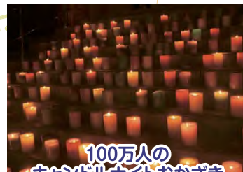
100万人の キャンドルナイトおかげさき 主催 100万人のキャンドルナイトおかげさき実行委員会 ほか