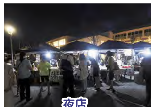
夜店 (夏休みちびっこ天国)