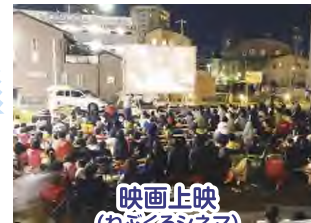
映画上映 (おぶぐるジネマ) 主催 岡崎製材(株) ほか