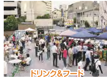
キッチンカー (岡崎トレッドゴードマーケット)