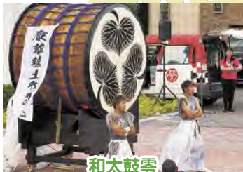
和太鼓零 (おとなの夏まつり)