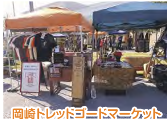
岡崎トレッドゴードマーケット ●毎月第2土曜日に開催 (8月、12月を除く)