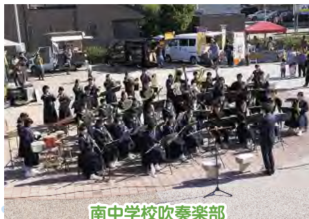
南中学校吹奏楽部 (スチューデントジャズコンサート) 主催 ジャズの街岡崎発信連絡協議会