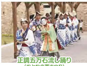
正調五万石流し踊り (おとなの夏まつり)