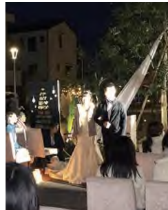
ウエディングセレモニー (X'mas Nightフェスティバル) プロデュース ララチャンスOKAZAKI迎賓館