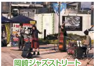
岡崎ジャズストリート プレイベント 主催 NPO法人 岡崎ジャズストリート ほか