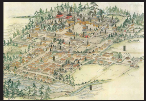
大樹寺惣絵図(東京国立博物館蔵)

寛永18年(1641)に、徳川家光が本堂から三門、総門を通して岡崎城が望めるように大樹寺の伽藍を造営してから232年後、明治維新を迎えた新しい時代には岡崎城は不用とされ、廃藩置県後の明治6年~7年(1873~1874)に解体されましたが、岡崎の象徴である天守閣がないままではしのびないとする