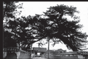
大樹寺三門より総門を望む(1899)