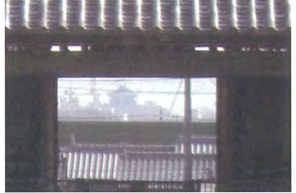
大樹寺から岡崎城を望む

大樹寺境内の山門から、小学校の敷地を隔てた総門を通して、3Km南の岡崎城を正面に望む眺望景観は、古来より引き継がれてきた岡崎市のシンボリックな歴史眺望となっている。