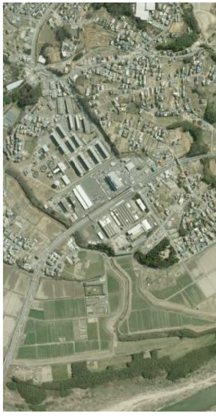
[航空写真（平成24年撮影）]