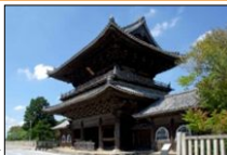
たいじゆじ 大樹寺三門▶

壮厳な佇まいの松平氏・徳川家ゆかりの寺社を中心に、家康公の偉業を称える様々な顕彰活動や伝統行事が行われ、郷土の英傑を輩出した生誕地として市民の大きな誇りとなっている。