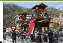
すが 須賀神社から神明宮への祭礼山車巡行▶

市東部山地にある額田地区では、自然条件に適応し営まれてきた様々な民俗行事が社寺や集落を舞台として伝えられ、個性豊かな山里のくらしが今も息づいている。