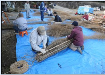
■松明作り(滝山寺鬼祭り)

民俗文化財の調査や記録、情報発信、また民俗文化財の活動を支援し、文化財の保存・継承及び地域の活性化を促進する。