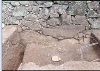
■岡崎城跡(本丸天守台石垣)

市指定史跡岡崎城跡の価値を高め、保存・活用することを目的に、発掘調査や文献調査等の詳細調査を実施する。