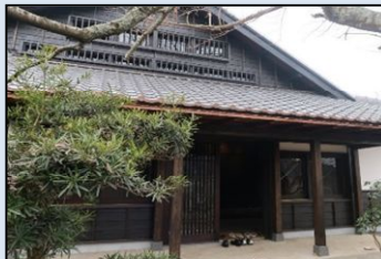
■歴史的風致形成建造物(修景後)

景観重要建造物又は歴史的風致形成建造物の外観の保全に係る修理・修景に対して支援する。