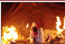
滝山寺鬼祭り(火祭り)▶

鎌倉時代、源頼朝の祈願に始まると伝えられている滝山寺鬼祭りは、旧暦正月7日に行われる火祭りで、重要文化財の滝山寺の境内地を舞台に鬼が乱舞する勇壮な祭りとして、地域に受け継がれている。