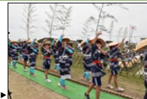
六ツ美悠紀斎田お田植踊り▶

古くから農業が盛んな六ツ美地区には、「御田扇祭り」、「六ツ美悠紀斎田お田植えまつり」の稲作儀礼が受け継がれ、田園地帯の集落の風景に農作業や祭りを行う人々の営みが調和している。