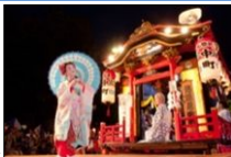
のみしんめいでう 能見神明宮の山車舞台での奉納の舞▶

江戸時代の町割りの一部や社寺の境内がそのまま残る旧岡崎城下を舞台に、当時から連続と行われてきた華やかな祭りが、往時の賑わいを感じさせている。