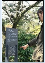
■歴史文化資産解説板(岡崎城跡)

歴史文化資産の周辺など来訪者の多い場所において、歴史文化資産の紹介や観光ルート等に関する案内板の新設・改修・修繕を行う。