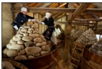
味噌蔵での石積み▶

旧東海道を挟んで建つ2軒の老舗が昔ながらの伝統製法により製造する豆味噌は、かけがえのない故郷の味であり、まちを歩くときほのかに漂う味噌の香りとともに、蔵造りのまちなみ景観が風情を漂わせている。