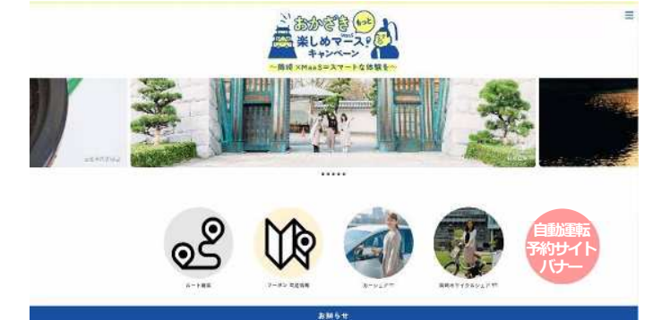
▲岡崎エリア版Maasアプリ予約サイトバナーイメージ