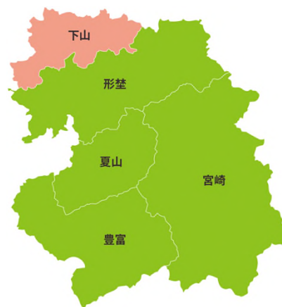
[図 1-1-4：旧額田町の学区区分]

下山学区は、額田地区の最北に位置し、学区の人口は 592 人（2022 年 4 月 1 日時点）で岡崎市 47 学区で最小、面積は 15 km 2 は旧額田町内の学区で最小。