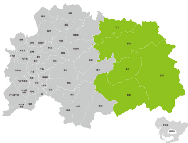
[図 1-1-2：岡崎市額田地区（緑色）の位置]

R3年度、岡崎市中山間政策課が創設され、現在市内の中山間地において、学区ごとに課題把握と地域プランづくりを推進している。