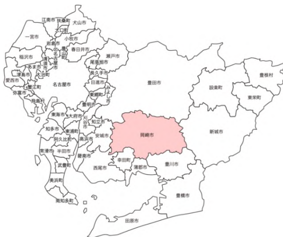
[図 1-1-1：愛知県における岡崎市の位置]

岡崎市は、愛知県のほぼ中央に位置する中核市。人口は384,996人（2022年4月1日時点）。面積は387.2 km 2 。市内を矢作川、乙川が流れ、水環境に恵まれている。江戸時代より岡崎城の城下町として整備され、東海道の宿場町として栄えた。徳川家康の生誕の地や八丁味噌の産地として知られる。