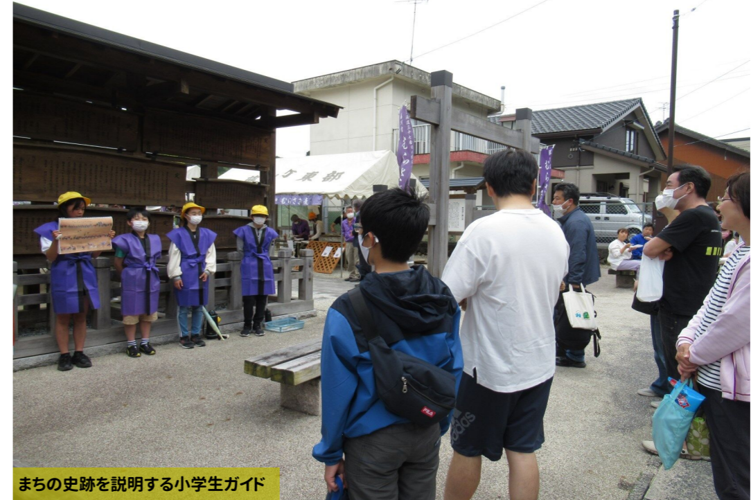
まちの史跡を説明する小学生ガイド