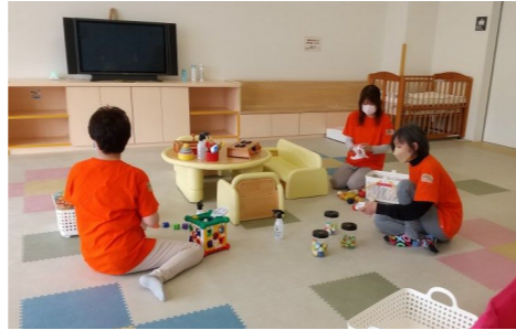
おもちゃをアルコール消毒しています

りぶらっこ☆ふあみりーの託児活動には「小さい子どものいる親御さんにも、図書館を気軽に使ってほしい」「核家族で子育てが大変な若い親御さんたちのちょっとした息抜きになれば…」「子育ての経験を活かし、若いお母さんたちを少しでも支えてあげたい」という思いが根底にあります。先進的な取り組み先に見学に行ったり、専門家から「救急時の対処法や子どもの発達」について学んだりして、安心して子どもを預けられる態勢を整えていったそうです。