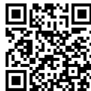
おかざき市民活動情報ひろば ボランティアのページ

【まちびとバンク常-37】りぶらっこ☆ふあみりー託児スタッフ募集をご覧ください。 右記二次元コードで検索、または りぶら市民活動センター(0564-23-3114)までお問合せください。