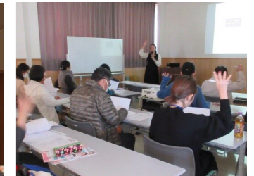
▲人を巻き込む仕組みづくり研修@悠紀の里 活動する上で必須となるコミュニケーションについて、情報の出し方や人との接し方などを学びました。