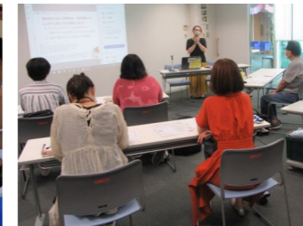
▲資金調達力強化研修@やはざかん 助成金等を獲得した団体の体験談を聞き、さらに助成金が求めていることを読み取るコツを学び、効果的なプレゼンを考えるワークを行いました。