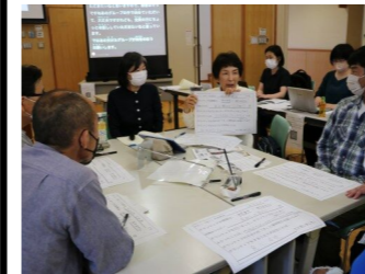
▲ボランティア研修@よりなん ボランティアの基礎知識、受け入れるときに心構え、信頼関係の築き方などを学び、ボランティアマインドを高めました。