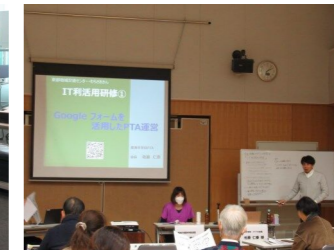
▲IT利活用研修@むらさきかん LINEやGoogleフォームを活用して事務負担を軽減し、活動の質を高めた団体の体験談を聞き、導入のメリットを学びました。