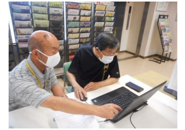
▲「おかざき市民活動情報ひろば」活用研修@なごみん リニューアルに伴い、大幅に機能が変った同サイトの更新方法を、じっくり丁寧にレクチャーしました。

すでに活動している人をはじめ、これから活動を始めようと考えている人など意欲的な人が多く集まったことで、スキルを身に付けることに加え、参加者同士の交流から新たな協働の芽が生まれる機会となりました。各研修のアンケートでは、満足度が非常に高く、「受講してよかった」「活動に活かしたい」「もっと学びたい」という高評価を多くいただくことができました。