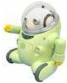
2004 Business Design Laboratory Co.,Ltd.