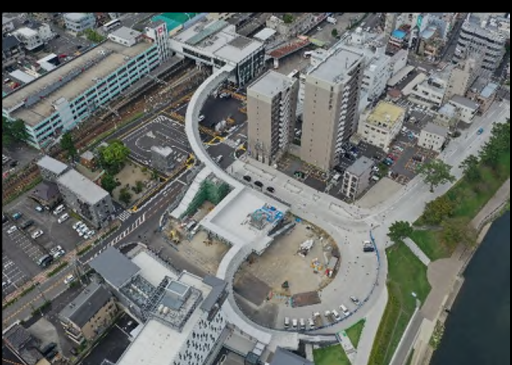
令和元年 10 月