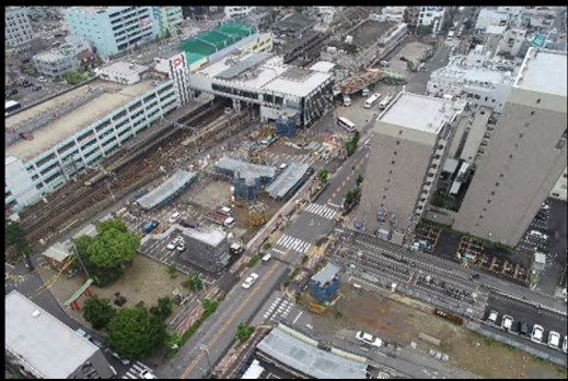
平成 30 年 5 月