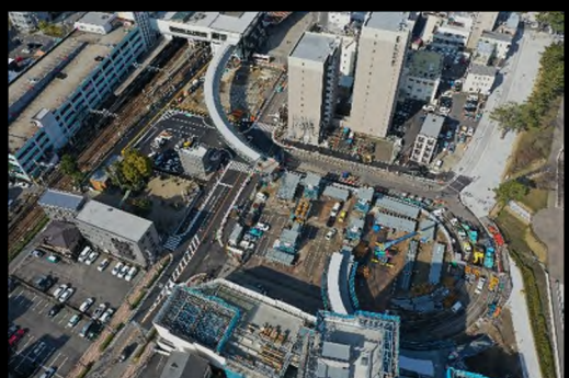
平成 31 年 2 月