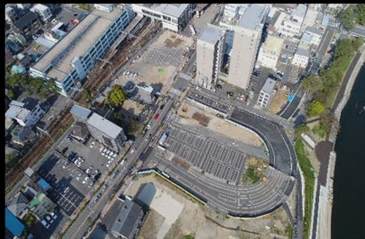
平成 30 年 4 月