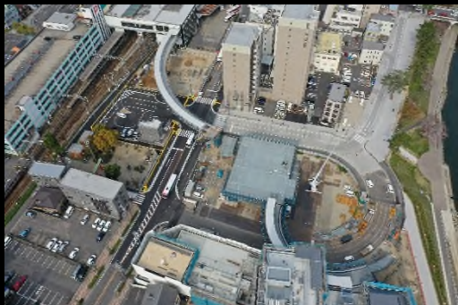
平成 31 年 3 月