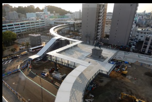
令和元年 11 月