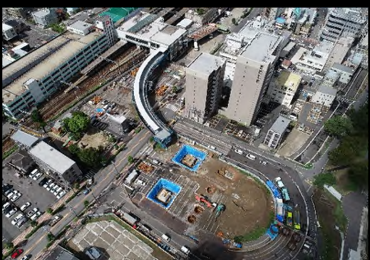
平成 30 年 9 月