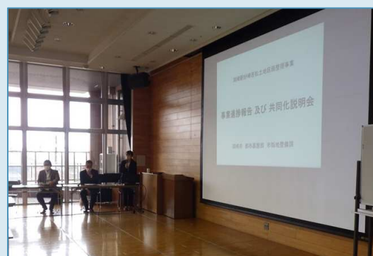
【写真】説明会当日の様子