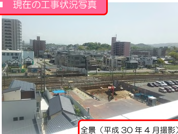
全景（平成30年4月撮影）