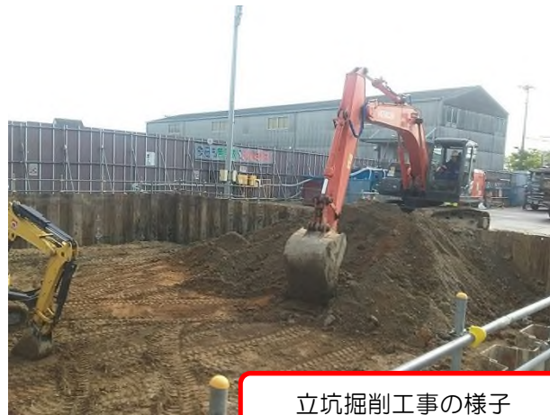
立坑掘削工事の様子