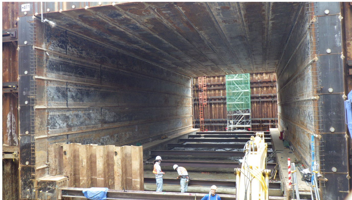
【西側から東側を望む】