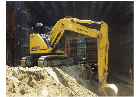
【線路西側立坑内の状況】