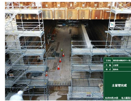
【線路西側立坑内の状況】