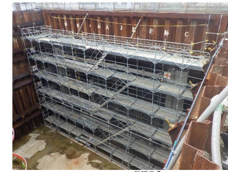
【線路東側立坑内の状況】