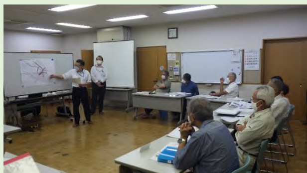
事業協力者によるヒアリング・検討の様子

7月以降、事業協力者のうち、特に2者が発起人会に参加し、提案されたまちづくりの方針や事業者の考えなどについての説明や、当地区についての地元ニーズなどのヒアリング、具体的なまちづくりの検討に向けた意見交換を行ってきました。