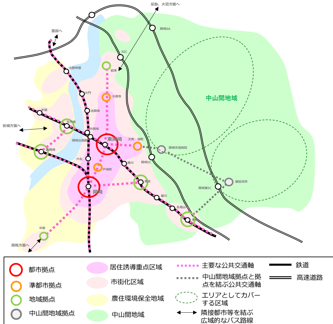
図 岡崎市が目指す交通の将来像