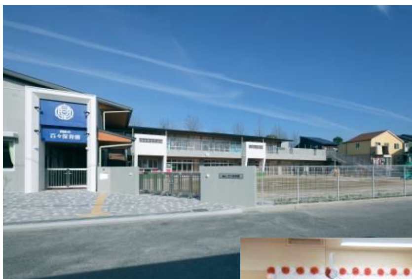
改築した百々保育園と 完工式の様子