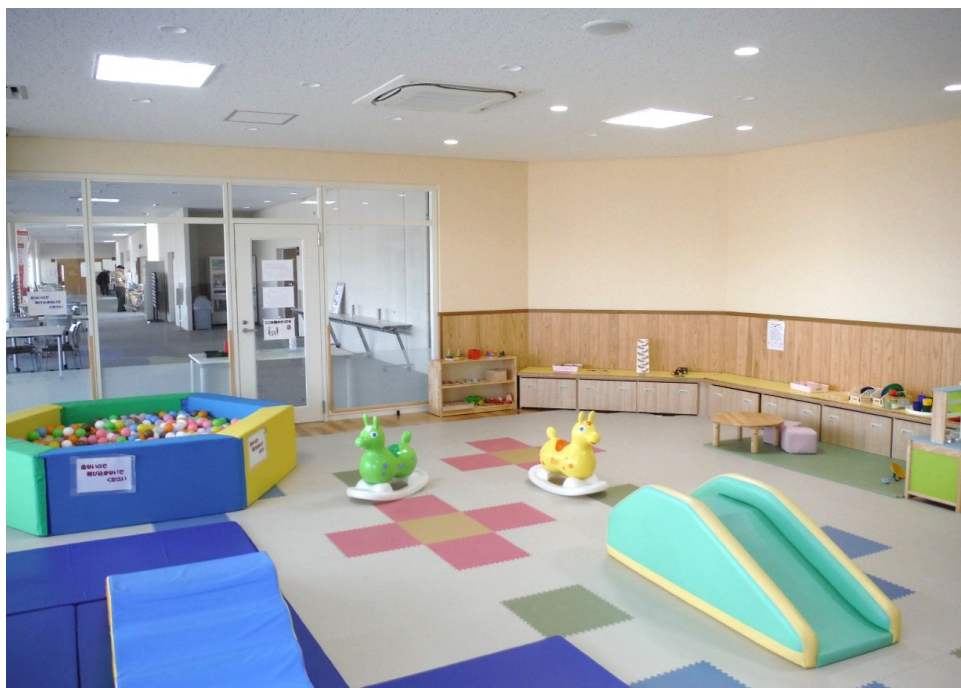
つどいの広場 地域交流センター六ツ美分館(悠紀の里) 平成27年4月～