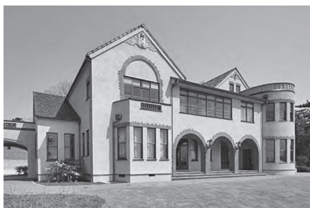
〈旧本多忠次郎邸外観〉