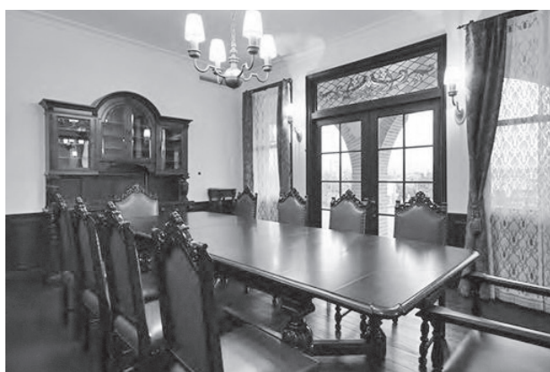
〈旧本多忠次郎邸内観〉