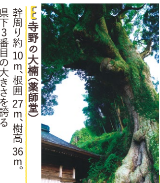
E 寺野の大楠(薬師堂) 幹周り約10m、根囲27m、樹高36m。県下3番目の大きさを誇る

木曾御嶽山に似た地形のために勧請された新嶽山から新峰山、おおだの山へと三つの頂を縦走。