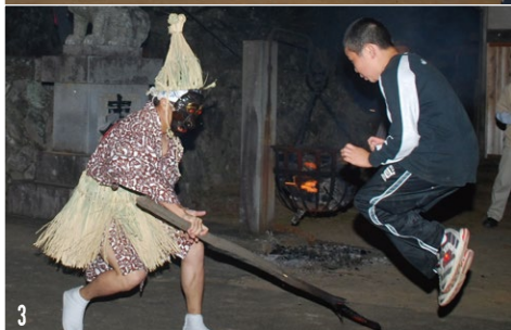
1 燃えさかる炎。むしろで煽ぐ鬼にも容赦なく火の粉が降り注ぐ 2 鬼を挑発する子どもたち。肩を組んでいれば燃え木を避けやすくなるのかな？ 3 両足で大きくジャンプ。“燃え木に打たれてみたいけど、打たれたくない”という気持ちが、ひしひしと伝わってくる微笑ましい一場面