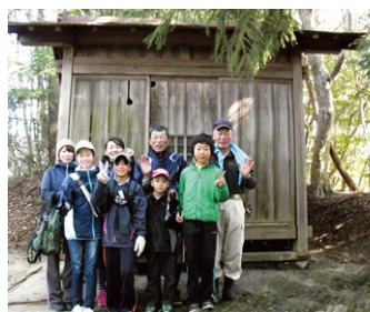
D 夏山城址 夢山の頂上にあったとされる夏山城。写真は近くにある秋葉社の祠