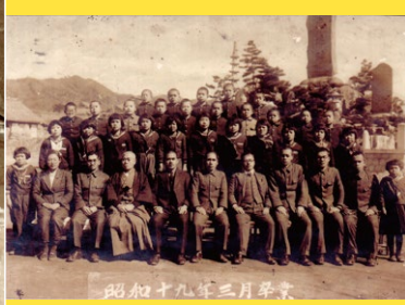
戦争の不安を抱えた中で行われた昭和19年の夏山国民学校の卒業式