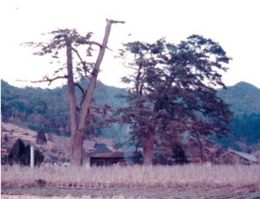
子どもが10人がかりでも抱えられないほどだった、でいもんの大松