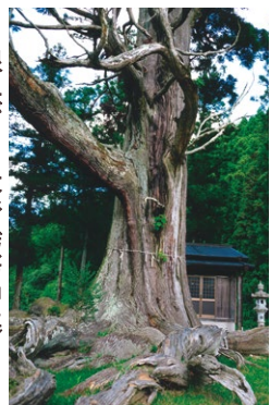
F 根上がりの大杉(諏訪神社) 樹高は約34m。大蛇がのたうつような様を見せる根の浮き上がりが見事