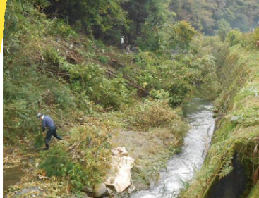
夏山川を覆ってしまう木の伐採をする夏山川環境整備ボランティア