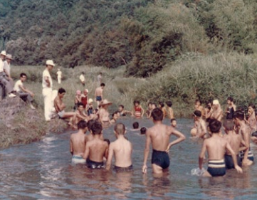
昭和49年まで学校の水泳指導も行われていた夏山川のこうとり場