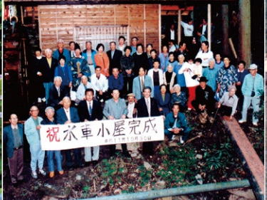
自然の中で遊べる小学校の夢山。そのシンボルである水車小屋が完成