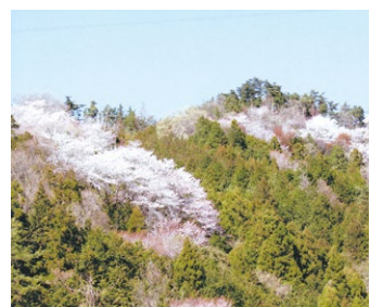
G 棕の木の山桜 山を覆い尽くすように咲く、美しい山桜。4月上旬頃に満開になる