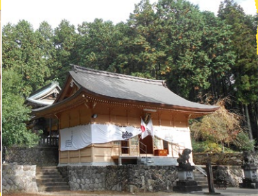
三河の古社の一つである夏山八幡宮。拝殿の奥に本殿を構えている