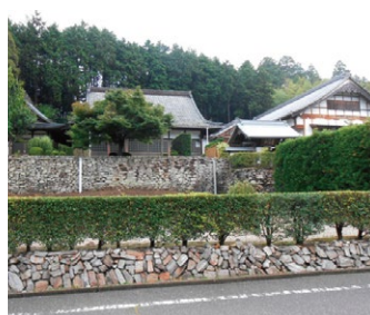
B 華蔵院 奥平氏ゆかりの寺。仙丸の首を包んだ血染めの打敷を大切に保管

戦乱の世に、わずか13歳で命を落とした奥平仙丸。その首を巡って仙丸の乳母や奥平家家臣である黒屋一族が繰り広げた愛と義の物語は、今も私たちの心を熱くします。また夏山には推定樹齢1000年とされる寺野の大楠や、根上がりの大杉といった巨木のパワースポットもあり、奥深い自然も知られています。歴史と自然に彩られた夏山を訪れてみませんか？