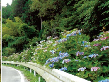
あじさいの道。毎年6～7月になると人々の目を楽しませてくれる