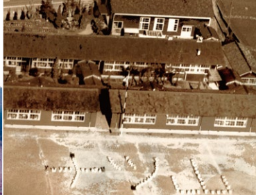
昭和32年から平成3年まで使用されていた木造建築の旧校舎