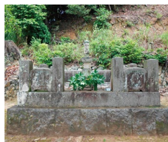
A 仙丸公墓所(遊仙寺) 奥平方は鳳来寺門前の仙丸のさらし首を奪って手厚く葬ったという