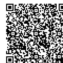
【補助金一覧表 QR コード】

岡崎市 住環境整備課 狭あい道路整備係 TEL23-6823 Fax23-7528