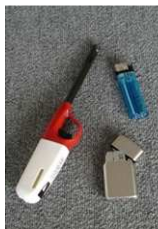
ライター・着火器具