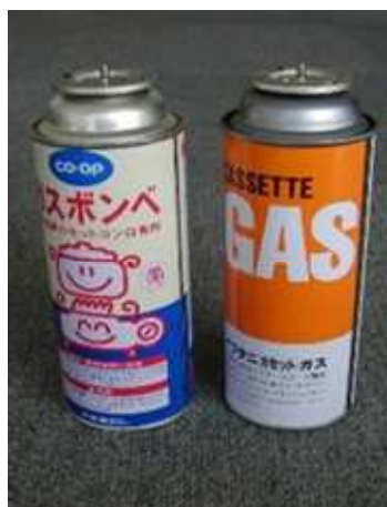
カセット式ガスボンベ