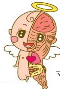
マスコットキャラクター 筋ちゃん天使