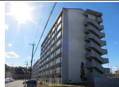
公営住宅等整備事業 整備イメージ