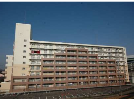
公営住宅等ストック総合改善事業 整備イメージ(耐震改修)