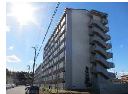
公営住宅等整備事業 整備イメージ

公営住宅等ストック総合改善事業 愛知県、岡崎市、春日井市、豊川市、刈谷市、安城市、みよし市