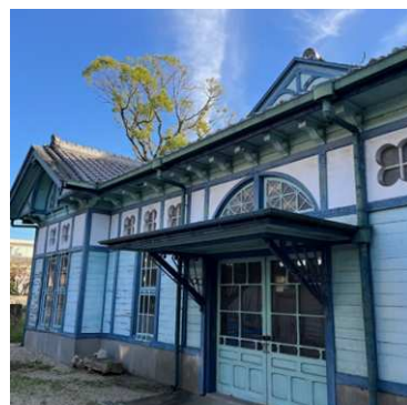
《旧額田郡物産陳列所》