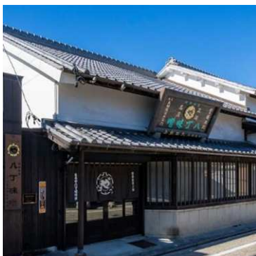
《(株)まるや八丁味噌事務所棟》