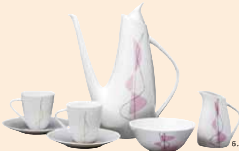
1. バヴェル・ヤナーク、テーブルランプ、1913年 2. ヨゼフ・チャベック、(オタカル・シュトルフ・マリエン著)『けだまの静寂』表紙、1920年 3. ラディスラフ・ストナル、(耐熱ガラスのティーセット)、1931年 4. チェスカー・ズプロヨフカ・ストラコニツェ社(シュコダ財団)、《チェゼタ・スクーター-501型》、1957年 5. ヴィクトル・オリヴァ、ポスター「週刊誌 黄金のプラハ」、1898年 6. ヤロスラフ・イェジク、コーヒーセット(ダグマル)、1960年 1-3、5-6:チェコ国立プラハ工芸美術館蔵 Collection of The Museum of Decorative Arts in Prague 4:個人蔵

本展では、チェコ国立プラハ工芸美術館の収蔵品を中心に、アール・ヌーヴォーの旗手アルフォンス・ミュシャから世界中で愛される現代のアニメーションまで、100年のデザイン史を代表する家具、食器、ポスター、おもちゃ、書籍など約250点により、幅広い魅力を持つチェコの文化をデザインの視点からたどります。時を超えて日常を彩り、人生を豊かにするチェコのデザインを、日本で初めて総合的にご紹介します。