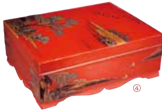
紅型コレクションが集結します