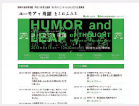
ユーモア展特設サイト画像

またFacebookページの公開にあわせ、スマートフォンからでもアクセスできるよう、ホームページのメニュー部分にも若干の変更を加えています。今までメニューが表示されずご不便をおかけしたスマートフォンユーザーのみなさまも、一度アクセスしてみてください。