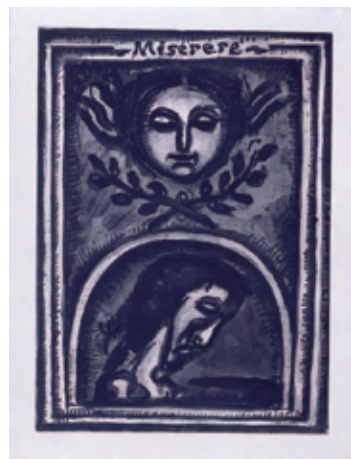
ジョルジュ・ルオー《ミゼレーレ》より 1923年 岡崎市美術館

祈り—それは古より人々の心に息づいてきた根源的な心情です。信仰の最も端的な表現である祈りは、教義や思想として文章に表されるだけでなく、絵画や彫刻等の作品として表現され、そのなかには人々の思いが込められています。今回の展覧会では当館の収蔵品を中心に、いにしえから近代に至るまで、洋の東西を問わず、人々の祈りや願いが表現された資料や美術品を紹介いたします。