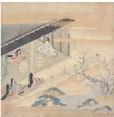
六条院の暮し 初音 サントリー美術館本「源氏物語画帖」

明石の君が、別れて暮す姫君に、鶯の初音ならぬ初便りを求めた一首である。初春を迎えて浮き立つ六条院、その華麗な暮しを、さらに長閑に華やかに彩る——鶯の声こそは、それであつた(続く)。