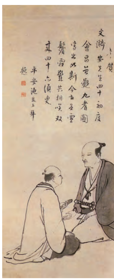
図1「三上孝軒・池大雅対話図」池大雅筆・賛

そこで次回は、思いもかけない趣向の「自画像」(?)を一点紹介し、読者を驚かせようと思う。