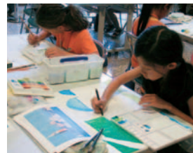
絵を描く子どもたち

気になるモチーフを選び出して、組み合わせ、自分だけのオリジナルな風景面を作り上げてもらいます。いわば、コラージュ風景です。事前に見本を作ってくださった小川さんは、一言「こんなに難しいとは…」しかし、