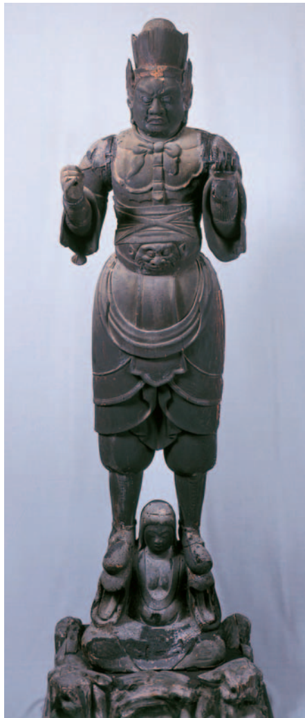
兜跋毘沙門天立像 庚申堂藏

天は多聞天の異形で、外敵から王城を守護するものとして平安時代に盛んに制作されました。両像とも頭に宝冠を載せて、皮鎧を着け、地天女の両掌の上に立っていますが、一軀は腹部に獅嚙と、腹巻状の帯をつけています。ともに頭から地天女までの主要部は桧材の一木造、目は彫眼で、当初は全身に彩色が施されていたとみられ、両腕に持つべき戟、宝塔は欠失しています。いずれも量感豊かな体軀に鋭い彫り込みがみられ、