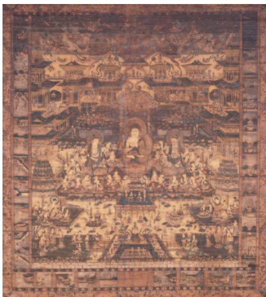
当麻曼荼羅 阿弥陀寺藏

本展が、身近な地域の歴史や文化と現在の私たちの生活との結びつき、さらには地域の将来を考えていく手がかりとなれば幸いです。