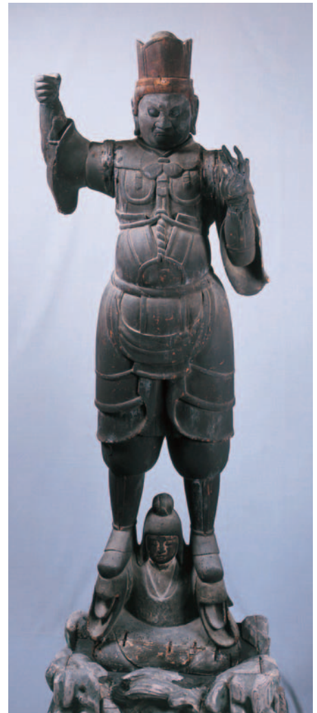
兜跋毘沙門天立像 庚申堂藏

多少の時代差はあれ、平安前期(9世紀)の作品例として美術史的な価値も高く、古像が2軀揃って伝存する全国的にも貴重な作例です。ただし兜跋毘沙門天は2軀を一組とするものではなく、縁起によると毘沙門天と持国天の二天として祀ってきたようです。