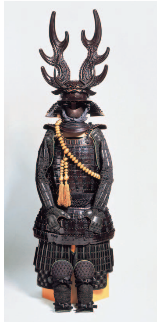
本多忠勝所用具足 個人蔵