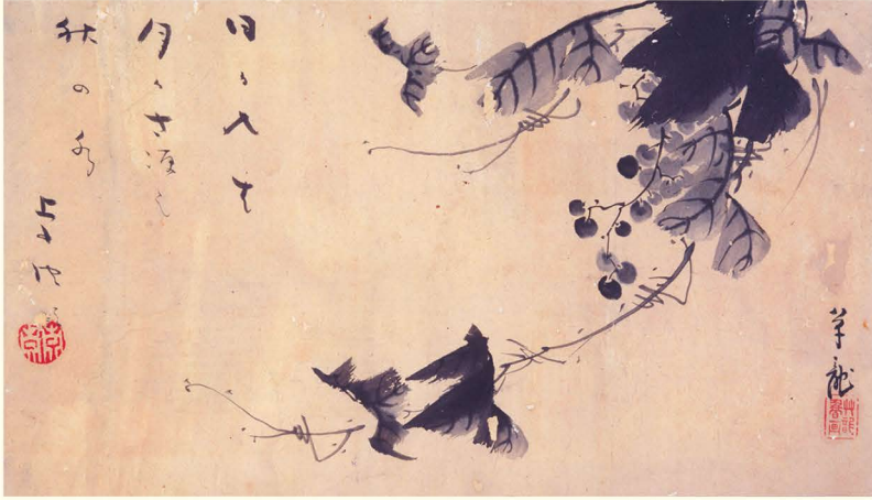
鶴田卓池賛・草龍画《山葡萄図并句》 岡崎市美術博物館蔵

会でより楽しく鑑賞するための道具として、手に取ってほしい一枚です。また子ども向けワークショップも企画しています。 そして、今回の展覧会は岡崎市在住の六十五歳以上の方と小中学生は入場無料です！ さらに、造形おかさきつ子展の開催日には、大人の方（高校生以上）は半額で入館できます。家族みんなで、またお友達とともに、展覧会に足を運んでいただけることを楽しみにしています。