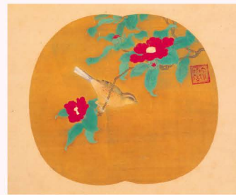
図2：宗誉 曾我宗室 大徳寺真珠庵蔵 《紅椿に小禽図》 「唐人物・花鳥図団扇」のうち