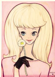
『ピンクの少女像』1959年 色鉛筆、鉛筆、水彩、ペン、紙 弥生美術館蔵