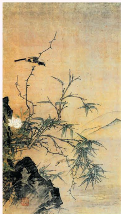
図1：宗誉 曾我宗室 出光美術館蔵 《花鳥図》