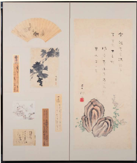
鶴田卓池他画賛 《岩花園并句》 岡崎市美術博物館蔵