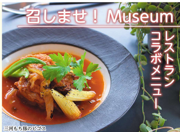
三河もち豚のピゴス