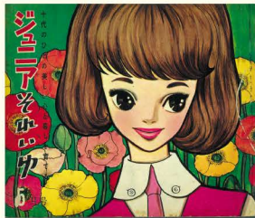
『ジュニアそっくり』第33号 1960年 個人蔵

現代にも脈々と続く「カワイイ」文化の生みの親であり、「Roots of Kawaii」と称されるルネ。生誕の地、岡崎でのエピソードを掘りながら、貴重な原画・作品と共に人間ルネに迫ります。