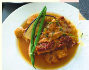
沖縄ソーキのジェノベーゼ

美術館に行く目的として、展覧会を見るのはもちろんですが、展示を見終わってからのコーヒースタンドにゆっくりする時間、おいしい食事を囲んで気の合う友人と感想をおしゃべりする時間もまた贅沢ではないでしょうか。当館では併設のレストラン「ユアテーブル」さんのご協力をいただき、展覧会にあわせた「コラボメニュー」を提供いただいております。