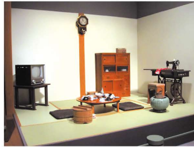
昭和30年代 茶の間の風景再現 (昨年度展覧会の様子)

今回で8回目となるこの展覧会は、美術博物館が所蔵する古い生活・生産道具などの寄贈資料を中心に紹介しながら、私達の暮らしがどのように変わってきたのかをたどります。そして、この時期の公立小学校3年生の社会科「古い道具と昔の暮らし」をお手伝いできるように、子ども達の見学に配慮した内容と工夫を凝らし、昔の道具を間近に見てもらう機会を提供することにより、今の暮らしを考える手助けとなればと考えます。