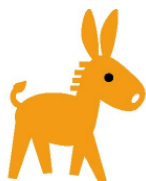
キャンペーンキャラクターのロバ隊長

岡崎市では、平成 26 年度までに 13, 500 人のサポーター養成を目標に、認知症になっても安心して暮らせるまちづくりを目指しています。