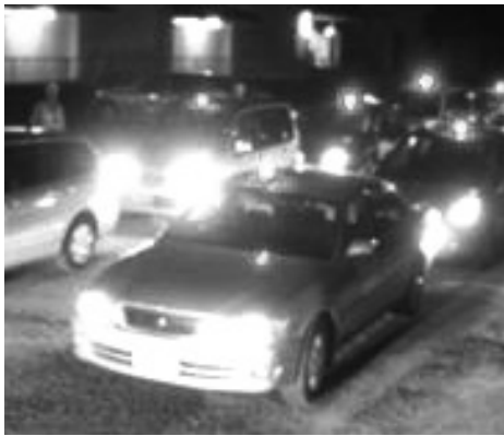
青色防犯パトロール車両

答 市内の自主防犯活動団体はほぼ全ての学区で設立されており、全148団体のうち県警から認可された39団体において300台を超える青色防犯パトロールの車両が登録されている。自主防犯活動団体は、徒歩や自転車による月1回以上の地域パトロールの実施、小学生の登下校時における見守り活動、犯罪及び交通事故防止のための研修受講等を行っている。また、青色防犯パトロール団体では週1回以上のパトロール