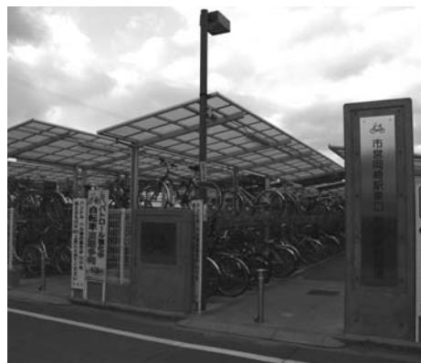
市営自転車駐輪場

る。自転車盗難は二重ロックにより被害が大幅に減少することが判明しており、鍵掛け等の徹底を呼び掛けるなどの指導を強化している。無人の自動開閉装置は設置費用が1カ所につき約1000万円、5年リースでは管理費を含めると月額25万円程度となるため、仮に有料化に係る受益者負担を試算すると自転車1台につき月額約1000円となる。駐輪場の有料化については、有料化に伴い周辺に放置自転車の増加も予想され、撤去費用が必要となるため駐輪場の利用状況や盗難防止対策を分析し、費用対効果などの面から今後検討したい。