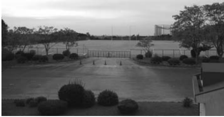
県岡崎総合運動場

答 県施設が本市に移管された場合、管理運営費が大きな負担となることが心配され、また、本来広域的である施設の設置目的を変更するという大きな問題となるため、野外教育センターについては県施設として存続を求める趣旨の意見を、岡崎総合運動場については県の広域的な役割を踏まえ、引き続き整備を進めて欲しい旨の意見をそれぞれ提出している。また、愛知病院は、がん治療専門病院、特に緩和ケアにおいて重要な役割を担っており、救急医療を含