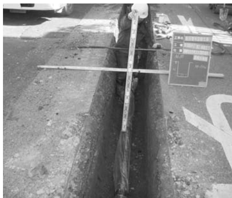
水道管敷設替工事

「現在、配水管の鑄鉄管敷設替えを進めているが、完了はいつか。また、火事で消火栓を使用すると近隣に赤水が出ると言われているが、敷設替えにより解消されるのか」との質疑があり、「水道創設時の昭和7年から30年代にかけて敷設された鑄鉄管は内面にさびを防ぐ処理がされていないため、さびが発生し赤水の原因となる。また、継ぎ手部分が弱く耐震性も低いため、平成11年度より計画的に敷設替えを行っている。19年度末の進捗率は54%であり、25年度の完了を目標にして進めている。これにより、消火栓使用による赤水の発生が抑制される」と答えた。