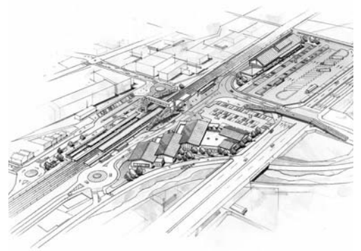
藤川地区整備計画(イメージ図)

「藤川地区整備事業の総事業費と年間利用者数の見込みについて伺う」との質疑があり、「本市整備分としては、地域交流センター、道の