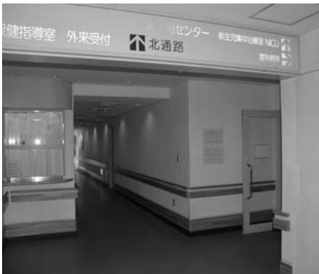
市民病院周産期センター

答弁 入居申し込みの際や既存入居者による迷惑行為があった時など、疑わしいと思われる場合に愛知県警へ照会し判断する。これにより暴力団員と判明した場合は、自主退去、あるいは暴力団からの脱会をお願いしていく。また、不正行為及び住民や職員に対する恫喝などを行い、市との信頼関係が損なわれるような場合には、住宅の明け渡し請求を行っていく。