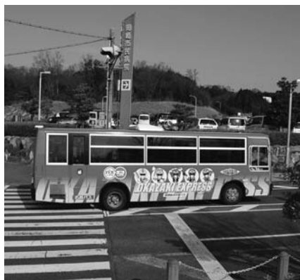
基幹バス（岡崎拠点快速バス）

本市では、公共交通のネットワークとして市内バスの骨格となる基幹バス路線の実験運行を行っており、既存のバス路線と連携した持続可能なバスネットワークを構成することが大きな目的である。本市の総合交通政策では、都心地域と郊外中山間地を結ぶ路線のうち、基幹バス路線を優