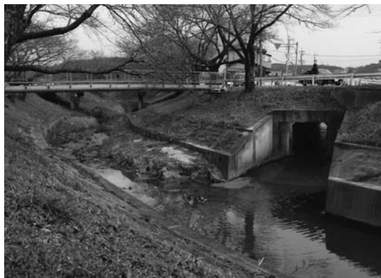
伊賀川と小呂川の合流点

行うとともに、旧食肉センター跡地の利用についても検討していく。また、今回の豪雨で制御盤が浸水した稲熊8丁目の内水排除ポンプも、平成21年度のポンプ増設工事とともに出水期までにかさ上げ工事を行っていく。更に、伊賀川合流点から準用河川ミタライ川合流点までの河床の石の撤去についても浚渫工事に含めて21年度から順次実施していきたい。