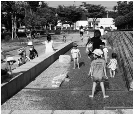
奈良井公園せせらぎ水路

奈良井公園のせせらぎ水路は、市内で唯一、小さな子どもが安心して水遊びができる場で、今年の夏も連日多くの子ども連れが楽しんでいた。水遊び場は子どもの遊び場としてなくてはならないものと考えているが、既存の公