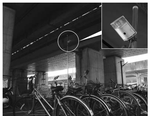
本宿自転車駐り場

答 平成20年度の防犯灯の設置は800灯近くになる予定で、総数は2万4千灯を超える見込みである。LED型防犯灯は、