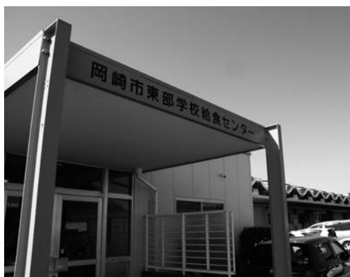
東部学校給食センター

答弁 周辺整備や地元との協議を進め、26年4月のオープンを目指している。現在は小学校13校と中学校5校に配食しており、新たに、自校式で調理している額田地区の小中学校のうち、配送時間を考慮して額田中学校と豊富小学校に同センターから配送したいと考えている。