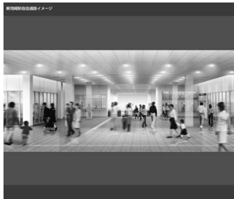
東岡崎駅自由通路(イメージ)

答 今後の事業展開としては、自由通路、橋上駅舎、駅前広場、駅ビルの整備などを考えており、基本的には名鉄と連携して一体的に行うことが望ましいと考えている。見直しの視点を更に整理し、21年夏頃には事業主体、事業量、整備内容などの個別の事業計画案を公表し、議会の合意を得た上で決定して、秋頃には24年度を目標としたバリアフリー化と東改札口の設置などの短期的整備事