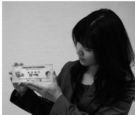
プレミアム付商品券

待している。また、振り込め詐欺対策として、被害を未然に防ぐため警察や金融機関と連携するほか、ホームページや市政だよりに掲載し啓発に努めていく。