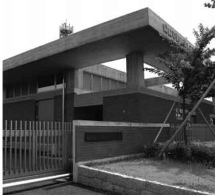
砂川雨水ポンプ場

答 国の新たな事業である床上浸水対策特別緊急事業の採択を受け、長年の懸案となっていた伊賀川、鹿乗川、広田川と砂川、占部川について25年度をめどに河川改修工事を進めていく予定である。また、中島紅蓮地区では広田