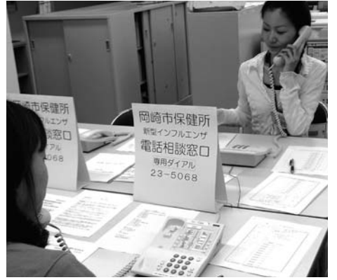
発熱相談センター