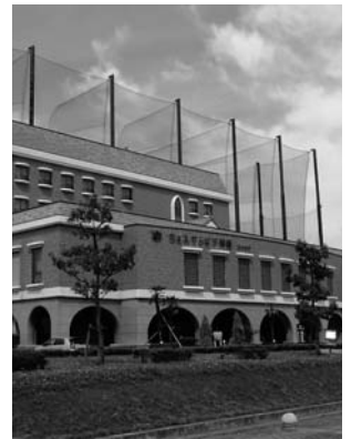
ウエルサンピア岡崎

問 これまで存続を要望してきたサンピア岡崎は独立行政法人年金・健康保険福祉施設整理機構（RF0）により譲渡や廃止が決定される予定だが、今後のスケジュールは。また、市の施設として購入の意向やその支援策について伺う。