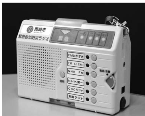
緊急告知防災ラジオ

要望していたもので大変評価する。今後は、有償配布追加導入も前向きに検討するとともに、防災ラジオを活用して、国からの瞬時警報システムであるJ-ALERTの一斉受信ができるよう要望する」と意見を述べ、賛成した。 【無所属・日本共産党】は、「既に緊急告知防災ラジオの無料配布がされている8月末豪雨で床上浸水の被害を受けた世帯の近隣と、東海豪雨の被害世帯のうち要援護者世帯、高齢者世帯には無償配布を要望するとともに、できる限り多くの人が購入できるように今後も必要な台数を確保されたい」と意見を述べ、賛成した。