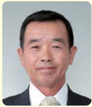
議長 野村 康治