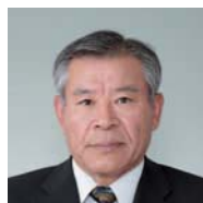
委員 ゆう 加藤 学 六名新町 ☎55-3931