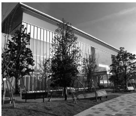
図書館交流プラザ

答 図書館ネットワークは、額田図書館のほか7カ所の市民センター、太陽の城、岡崎げんき館を地域図書室として運営している。各施設では共通の貸し出し証で資料を借りられ、すべての施設の資料を取り寄せ、どの施設でも受け取る仕組みが構築されている。また、家庭でもインターネットの環境があれば、図書館のホームページから検索や予約ができる。各施設における要望については、特に児童図書の充実が地域の声として上がっていたため、矢作・岩津・南部市民センターにおいては、その施設改修の機会を捕らえて児童スペースを確保し、資料の充実を図ってきた。