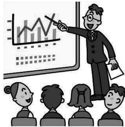
供も行っていく」と答えた。