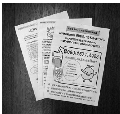
ところホットライン/啓発チラシ

「自殺予防対策業務の関係で、さまざまな悩みを抱え込んでいる人に対して、ところホットラインを行っているが、最近の状況について、また、家族からの相談はどのような対応をしているのか伺う」との質疑があり「ところの健康づくりネットワーク会議検討部会を開催して関係機関の連携を強化し、