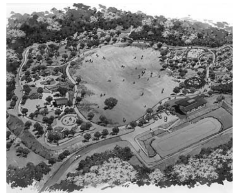
子ども自然遊びの森(イメージ図)

子どもが遊びを通じて豊かな自然と触れ合い、自然を身近で大切に感じる心を育む環境教育の推進を図ることを目的とする、子ども自然遊びの森の設置及び管理に関