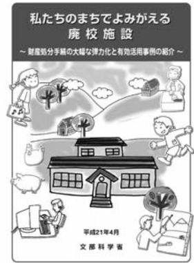
財産処分手続の弾力化・簡素化パンフレット

補助金の返還なしに行うことができるものである。総務省所管の補助金についての基準の通知を皮切りに、各省庁も追隨する形で通知がなされている。