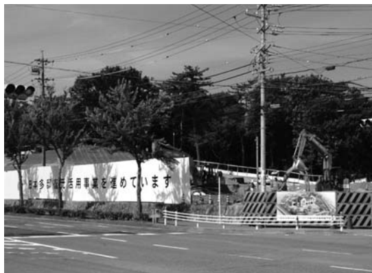
日本多邸復元建築工事

近年の文化財行政の考え方は、従来の保護重視の施策から、保存だけでなく積極的に公開し、有効に活用してこそ文化財としての価値が更に高まるという認識が広まっている。本市もそう