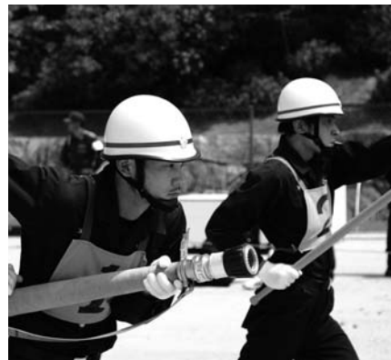
消防団操法大会の様子