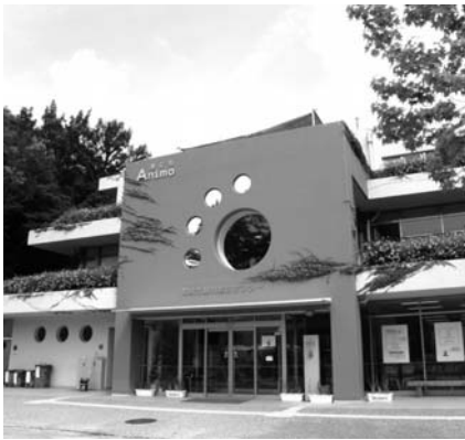
動物総合センター

動物総合センターは、動物に関する相談に対しワンストップサービスを提供することを目的に、犬猫などのペットに関する事項、東公園動物園の管理運営、産業動物の診療、野生動物の保護業務などの窓口を一元化した施設であり、動物愛護思想の普及啓発拠点、動物に関する教育学習拠点を目指し事業を展開している。今後は、館内での教育的取り組みを充実させるとともに、学校などへのふれあい教室の開催回数を増やしていく。また、子ども科学館は子どもたちのための体験学習機能をメイン機能と考えている。具体的には、科学体験機能、自然体験機能、理科学習支援機能がある。動物の生態を学ぶことや動物と触れ合うことは重要な自然体験の一つと考えており、子ども科学館での疑似体験と動物園での実体験を融合させるなどして科学の目と豊かな心を育みたい。