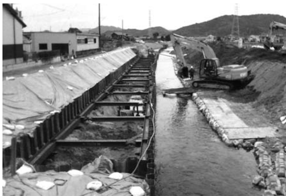
占部川下流の改修状況

問 六名地区に新設予定である(仮称)六名ポンプ場のこの川への排水について、河川管理者である県との協議状況と事業実施